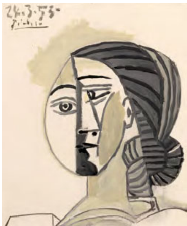
パブロ・ピカソ 「女の顔」油彩 1953年

日本の美術館の観客動員数は世界でトップクラスにも関わらず、アートを所有している日本人は少数派。アートのあるライフスタイルの最初の一歩になればと企画いたしました。一度は耳にしたことがあるであろう、世界で最も有名な画家ピカソをはじめ、美術の教科書や美術館でお馴染みの画家の作品を厳選しております。